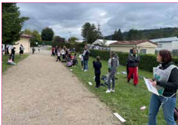
ENSEMBLE POUR VAINCRE LA MUCOVISCIDOSE

Un grand bravo à eux ainsi qu'aux parents et bénévoles venus prêter main forte. Notons que Groissiat reste l'une des seules communes du Territoire à participer à cet événement au niveau élémentaire, saluons cette initiative au profit d'une association !